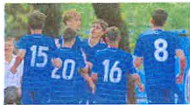
DINAMOVCI kadeti i pioniri pobijedili su u derbijima s Hajdukom

Plavi su pobjedama preuzeli prva mjesta u obje kategorije od dosadašnjeg lidera Hajduka