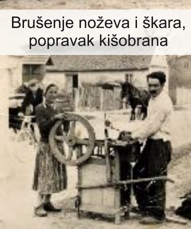
Brušenje noževa i škara, popravak kišobrana