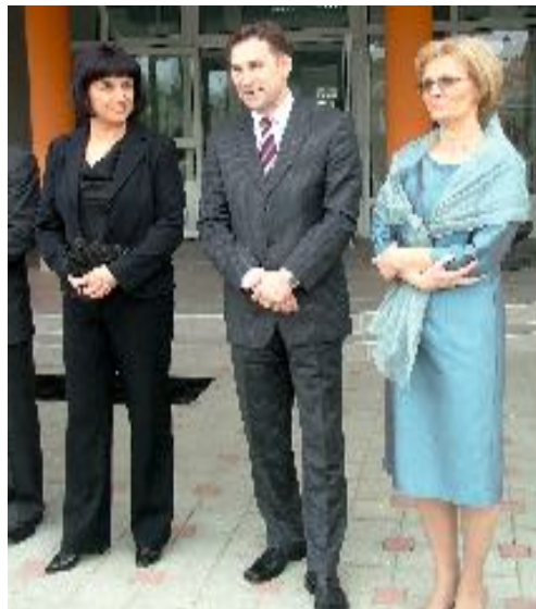
Otvorenje škole i dvorane