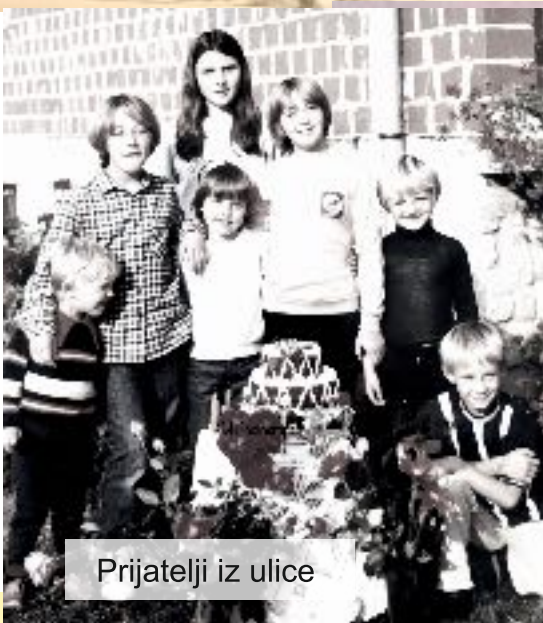
Prijatelji iz ulice