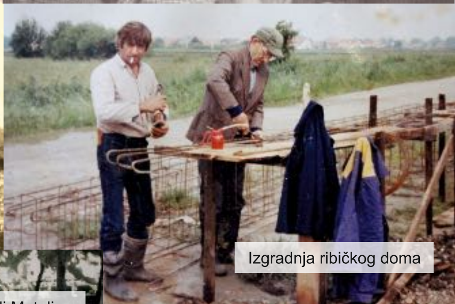
Izgradnja ribičkog doma