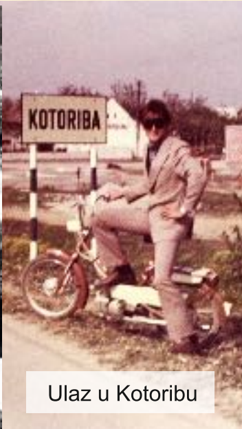
Ulaz u Kotoribu