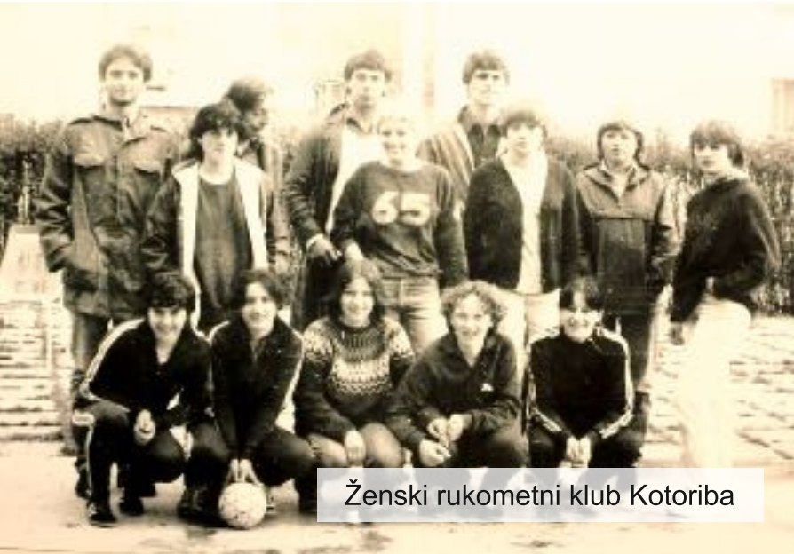
Ženski rukometni klub Kotoriba