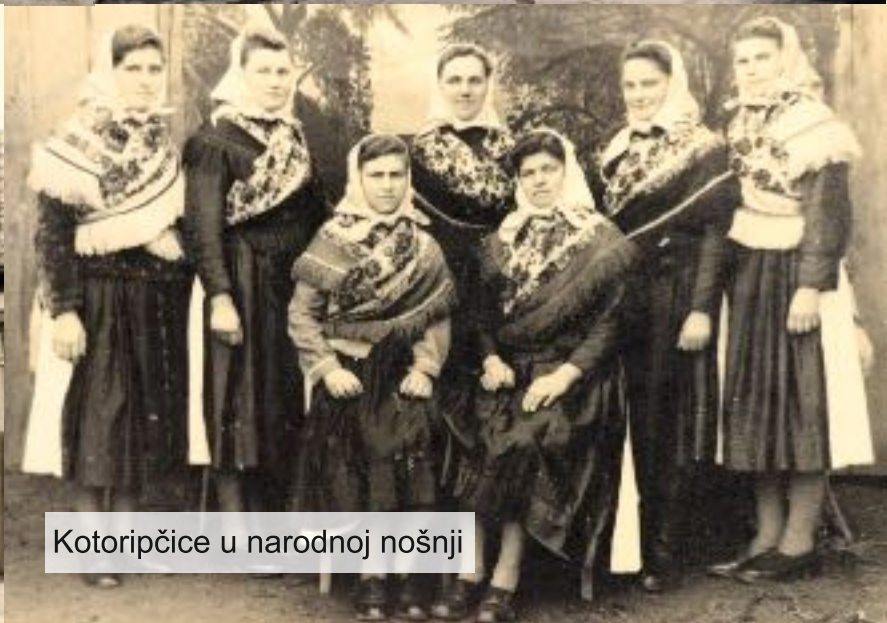
Kotoripčice u narodnoj nošnji