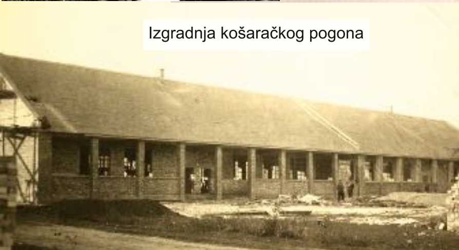
Izgradnja košaračkog pogona